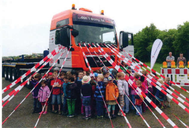
Universal Transport unterstützte die schulische Verkehrserziehung und veranschaulichte den „Toten Winkel“.

Mit einer praktischen Vorführung vor 149 Kindern aus regionalen Kindergärten und Grundschulen im niedersächsischen Barsinghausen zeigte der Schwerlastlogistiker Universal Transport welche eingeschränkten Sichtverhältnisse der Fahrer eines Schwerfahrzeuges hat und weist auch auf die Gefahrensituation für Berufskraftfahrer hin. „Total verblüfft schauen die Kinder, wenn auf einmal die Klassenkameraden vor oder hinter dem Fahrzeug nicht mehr sichtbar sind oder im sogenannten ‚toter Winkel‘ im Spiegel einfach verschwinden“, schildert Nicolai Koch, Geschäftsführender Gesellschafter der Universal Transport Niederlassung in Bad Nenndorf, die Eindrücke der Kinder, wenn sie selbst hinter dem Lenkrad sitzen und die Sichtverhältnisse aus dem Führerstand hautnah erleben dürfen. Für die Gefahren-demonstration in Barsinghausen stellt Universal Transport zwei Schwerlastsattelzugmaschinen zur Verfügung. Mit einem Absperrband wird der ‚tote Winkel‘ nachgestellt, um die Gefahren zu veranschaulichen, aber auch um die richtige Verhaltensweise im Straßenverkehr aufzuzeigen. Trotz großer Außenspiegel der Fahrzeuge kann es gerade beim