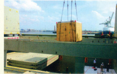
Am neuen Standort kann die akf Siemers-Gruppe jetzt größere Colli umschlagen.

Seit April dieses Jahres darf sich die akf siemers Gruppe über einen neuen Standort freuen: Die akf siemers seehafen ist jetzt offiziell Teil der Unternehmensgruppe. Jetzt hat akf eine äußerst positive Bilanz für den neuen Standort auf dem Gelände des Süd-West-Terminals in Hamburg gezogen. Dort könnten insbesondere größere Colli für „richtig große Projekte“ umgeschlagen werden.