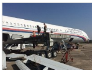
Волонтеры разбирают Ту-154

Винтик за винтиком самолетные фанаты разбирают на несколько частей лайнеры, которые привозили чешских солдат домой после выполнения миротворческих миссий, а также переправляли чешских президентов Вацлава Гавела и Вацлава Клауса на заграничные переговоры. В одном из отслуживших Ту-154 чешские хоккейные чемпионы вернулись в 1998 году с зимних олимпийских игр в Нагано с золотыми медалями на шее. Спортсменов тогда встречали в Чехии, как настоящих героев.