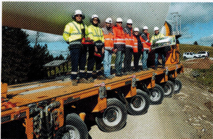
Jubiläums-Feierlichkeit im Windpark Moschkogel 2 in Österreich.

Prangl feierte Jubiläum! Das selbstfahrende Schwerlastmodul PSF3000 und die Rotorblattvorrichtung PFTV 300 haben das 100. Rotorblatt zum Endmontageort gebracht. Aus diesem Anlass fand eine kleine Feierlichkeit mit offizieller Übergabe einer Urkunde im Windpark Moschkogel 2 statt. Vertreter von Enercon waren ebenso dabei, wie natürlich auch die Spezialisten von Prangl. Goldhofer aus Memmingen hatte das Fahrzeug an das Unternehmen geliefert, das an der Entwicklung maßgeblich beteiligt war und es unter firmeneigener Bezeichnung in seiner Flotte führt.