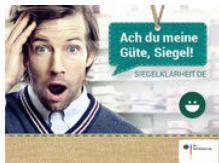
Nachhaltig einkaufen. Siegel verstehen!