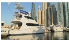
Luxus und Lifestyle: Dubai International Boat Show