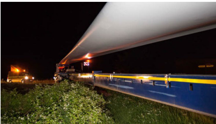
Millimeter-Arbeit: Langsam schiebt sich der Auflieger um die Kurve.