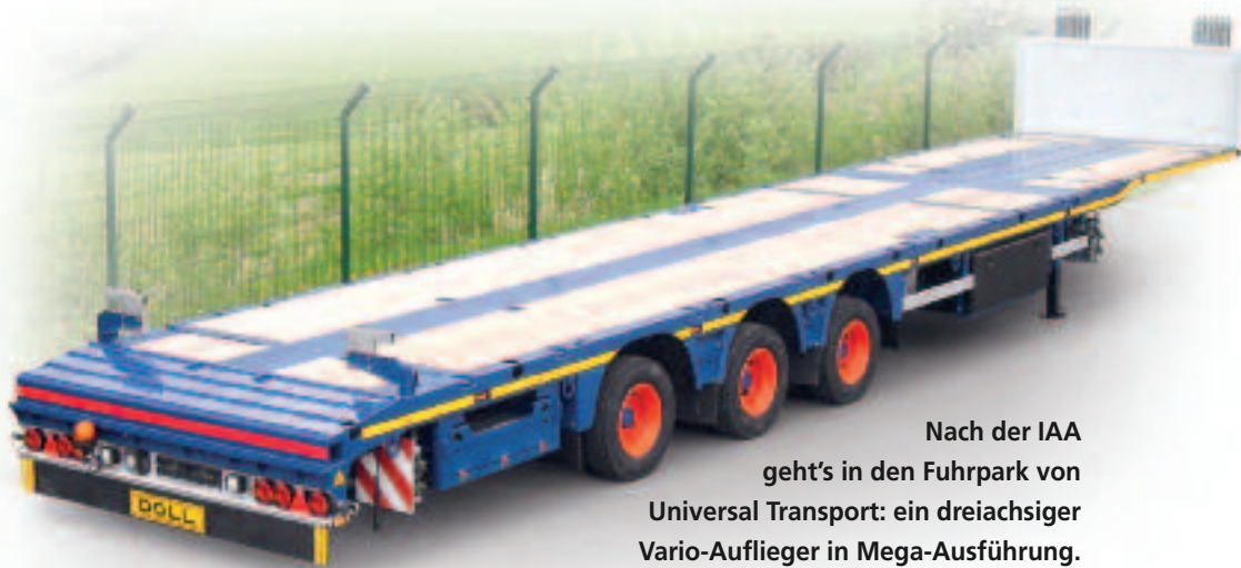
Nach der IAA geht's in den Fuhrpark von Universal Transport: ein dreiachsiger Vario-Auflieger in Mega-Ausführung.

80 mm Schwanenhals. Der international tätige Schwertransportlogistiker UTM setzt schon seit Langem auf die Doll-Auflieger und orderte dieses Jahr deshalb drei weitere Modelle in Mega-Bauweise. Zu den technischen Details des Tiefladers zählen eine Ladehöhe von 950 mm genauso wie ein Schwanenhals mit einer Bauhöhe von 80 mm für maximales Ladevolumen in Verbindung mit einer Sattellast von 12.000 kg.