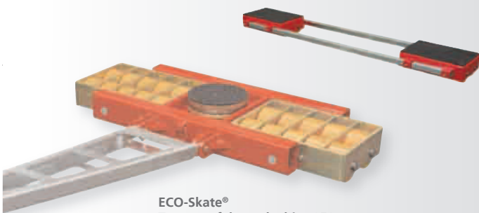
ECO-Skate® Transportfahrwerke bis >250t