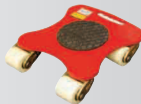
ECO-Skate® ROTO Rotationsfahrwerke bis 6t