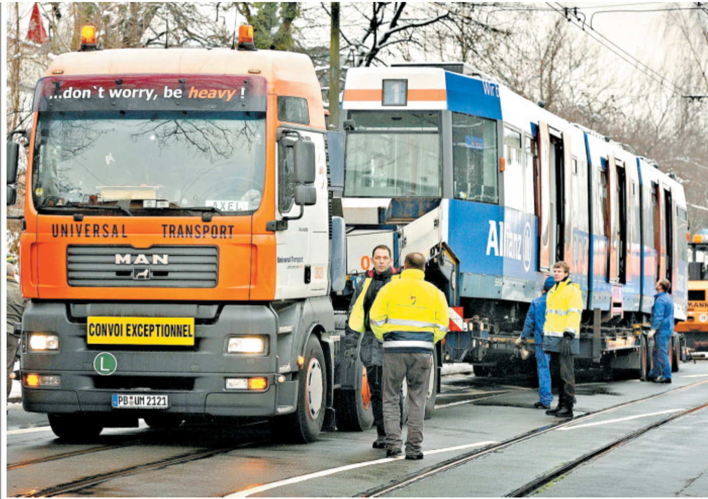
Ungewöhnlicher Schwertransport: Gegen 14.30 Uhr ist die erste der beiden beschädigten Bahnen auf dem 40 Meter langen Transporter verladen. Dann heißt es warten – die Fahrt des 90 Tonnen schweren Gespanns darf erst nach 22 Uhr starten.