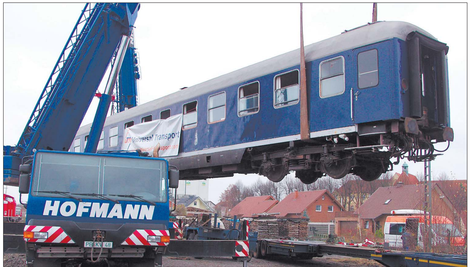
Ein »Blauer Engel« hebt ab: Um 10.40 Uhr hieften gestern zwei Kräne den 40 Tonnen schweren Waggon von der Schiene auf den Schwertransporter.

Um 5 Uhr hatte der »Blaue Engel« von Münster aus seine letzte Bahnreise angetreten, nun sollten 30 weitere Kilometer auf der Straße folgen. Die Firma Uni-