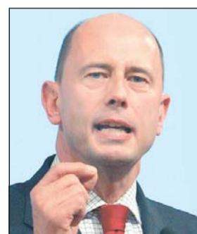
Wolfgang Tiefensee kündigt ein neues Angebot der Bahn an.

Berlin (dpa/ddp). In den erbitterten Tarifstreit zwischen Deutscher Bahn und Lokführergewerkschaft GDL kommt nach den Streiks der vergangenen Woche wieder Bewegung. Der Konzern will nach Angaben von Bundesverkehrsminister Wolfgang Tiefensee (SPD) der GDL ein neues Angebot vorlegen. Heute treffen sich Spitzenvertreter beider Seiten, darunter Bahnchef Hartmut Mehdorn und der GDL-Vorsitzende Manfred Schell, an einem geheimen Ort. Ein neuer Streik ist damit heute ausgeschlossen.