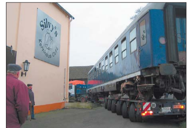
Der tückischste Moment des Transports: Der Waggon musste um die Ecke des Kornhauscafés zum darunter liegenden Platz rangiert werden.

ihrem Café hatte sie vorher entfernen müssen. Sie ist froh über den reibungslosen Ablauf: »Letzte Nacht habe ich wenig geschlafen.« Jetzt ist der Zug da und am kommenden Samstag, 24. November, wird er mit einer Party unter dem Motto »Samba Zamba« eingeweiht.