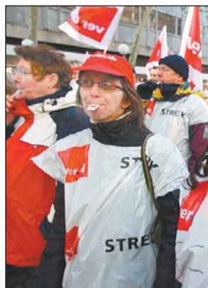
Noch sind Streiks im Einzelhandel die Ausnahme.

Seit die Verhandlungsführer vom Einzelhandelsverband und Verdi im September ohne Ergebnis auseinandergegangen sind,