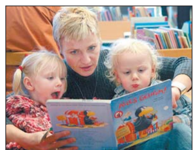
Vorlesen ist das Fundament des Bildungssystems.

Berlin (dpa). Viele Eltern in Deutschland lesen ihren Kindern zu selten aus Büchern vor. Das ist das Ergebnis einer Studie des Instituts für Demoskopie Allensbach im Auftrag der Stiftung Lesen. 42 Prozent der Eltern von Kindern im besten Vorlesealter unter zehn Jahren lesen demnach unregelmäßig oder gar nicht vor. Noch schlechter ist das Ergebnis in türkischen Familien.